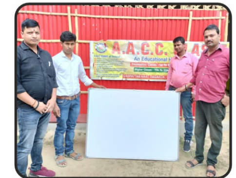
AACC शिक्षण को संस्था के द्वारा वाइट बोर्ड उपलब्ध कराया गया