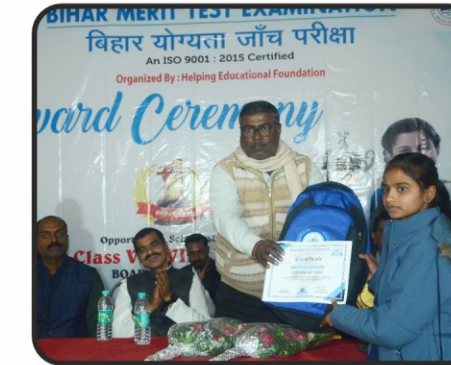
भट्टा बंगला मध्य विद्यालय के प्रधानाध्यापक द्वारा छात्रा को सम्मानित किया गया