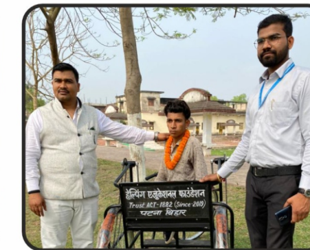
संस्था के द्वारा विकलांग छात्र को ट्राई साइकिल देकर सम्मानित किया गया