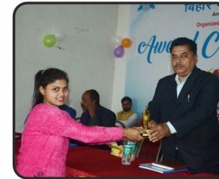
पुर्णिया प्राइवेट स्कूल एसोसिएशन अध्यक्ष द्वारा छात्रा को सम्मानित किया गया